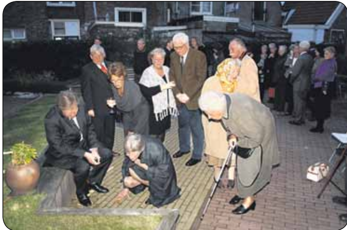
Regenten, oud-regenten en bewoners van het Johannes Enschedéhof én hofje van Bakenes