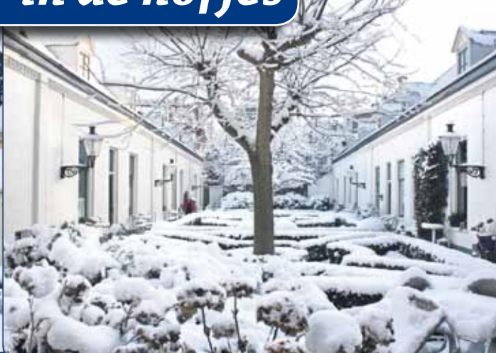
• HOFJE IN DEN GROENEN TUYN