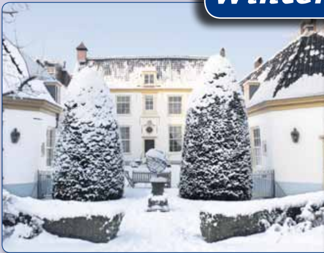
• VROUWE- EN ANTONIE GASTHUYNS